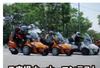
ご来場オーナーコンテスト