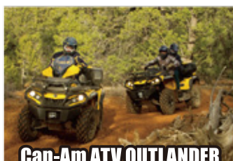
Can-Am ATV OUTLANDER 体験試乗