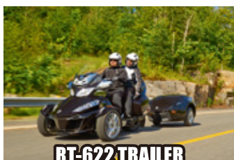
RT-622 TRAILER 展示&体験試乗