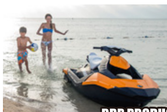
BRP PRODUCT LINEUP 展示